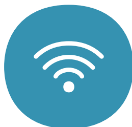
Inkluderet trådløs router med god wi-fi dækning