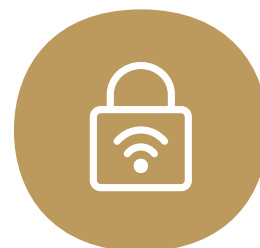
Indbygget sikkerhedspakke til pc, tablet og mobil

6 mdr. binding. Priser v/Automatisk Kortbetaling (ellers tillæg på 49 kr. pr. regning eller 9,75 kr. pr. regning v/BS). Oprettelse 299 kr. Forsendelse 99 kr. Se mere på yousee.dk/bredbaandsfakta .